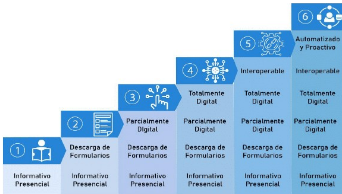
Imagen No. 2 Niveles de Transformación Digital de trámites, OPAs y consulta de acceso a informa