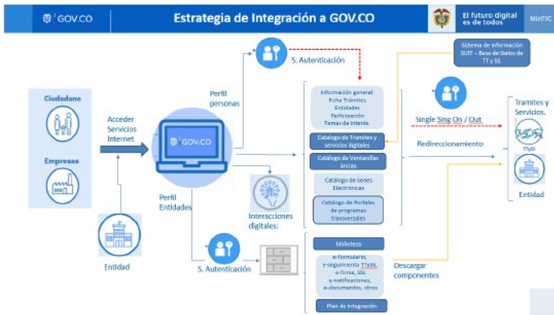
Imagen No. 4. Modelo de integración por redireccionamiento al Portal Único del Estado Colombiano