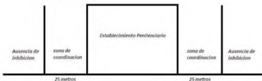
Figura 1. Límite de operación de IBSR

El uso de los IBSR se limitará solamente al interior de los ERON. Además, la ocupación de sus emisiones en las bandas de frecuencias objeto de inhibición, no debería superar en más de 25 metros (1) el perímetro de los mismos en aquellos ERON que se encuentren en área urbana, esto con el fin de garantizar la continuidad de los servicios de telecomunicaciones móviles, a los usuarios externos a los centros mencionados.