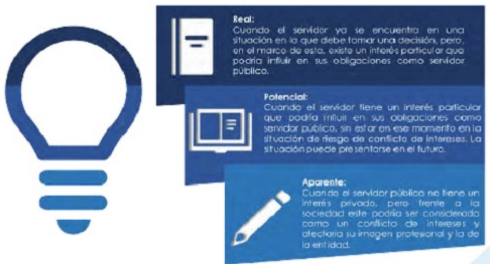
Ilustración 2: Tipos de conflicto: Tomado de DAFP. Adaptación de DPTSC basada en el documento “Gestión de los conflictos de interés” de la Oficina Antifraude Catalunya.

Recuperado de: https://www.antifrau.cat/es/conflictos-de-interes.html%20[#cuando-un-conflicto-de-inter%C3%A9s-es-real-y-potencial [Fecha de consulta 30 de julio de 2018].