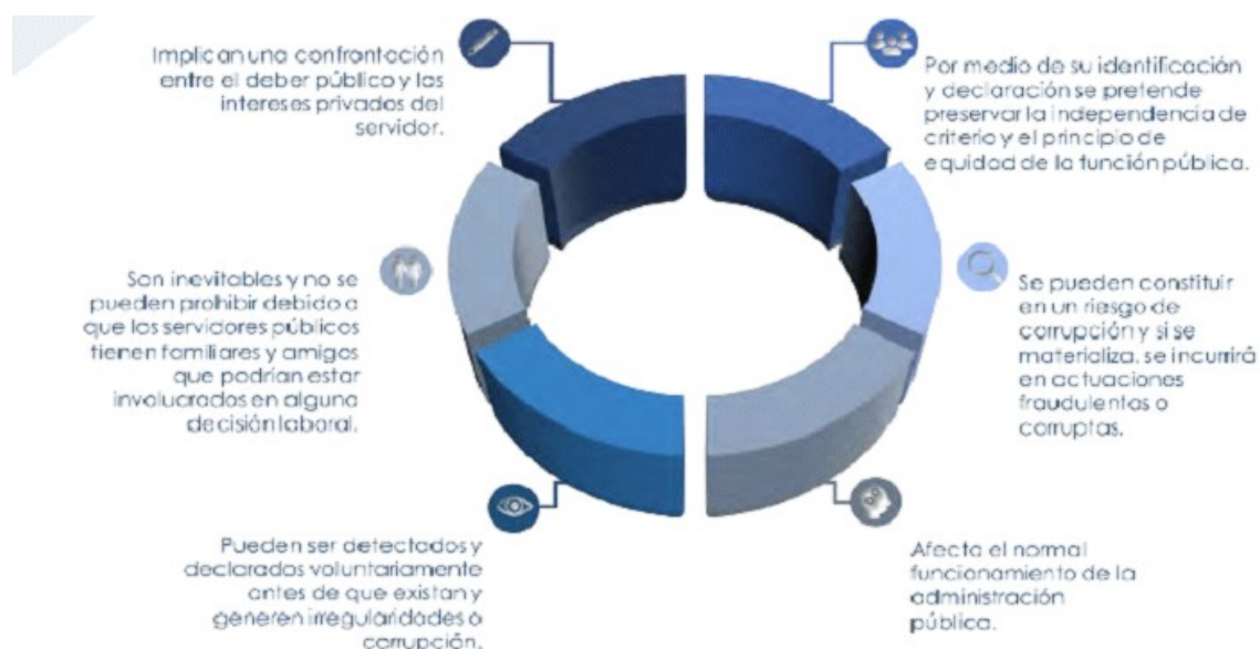
Ilustración 1: Características de los conflictos de intereses. Adaptado de (DAFP, 2017)