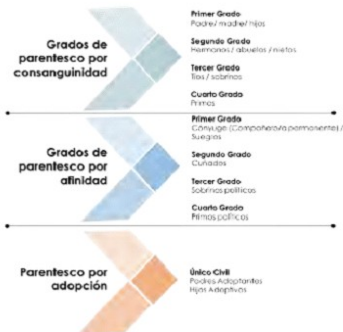
Ilustración 3: Inhabilidades por grados de consanguinidad

Se considera que un servidor público o contratista que tenga intereses particulares y directos en una decisión, o lo tenga su cónyuge o parientes dentro del cuarto grado de consanguinidad, segundo de afinidad o primero civil, o su socio o socios de hecho o de derecho, deberá declarar el conflicto de intereses.