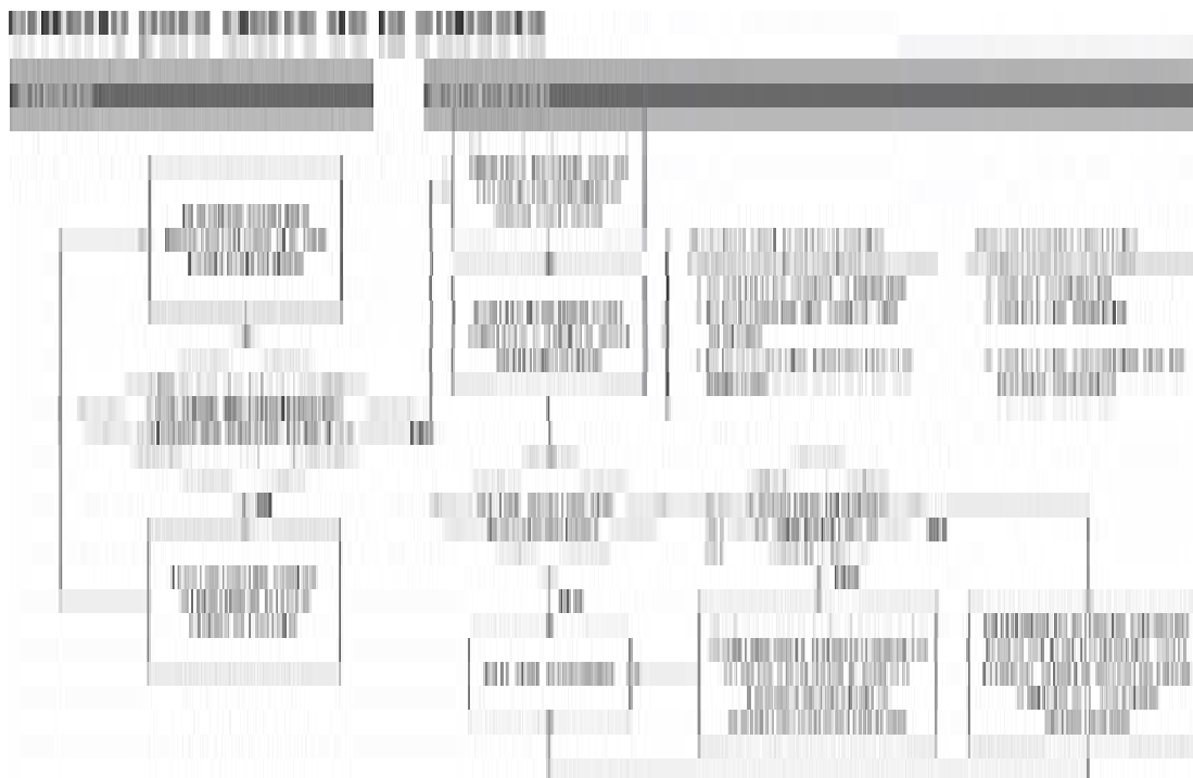
Cuadro No 4

Los Participantes con las Ofertas Económicas válidas serán los vencedores. Si en la última ronda el Participante confirmó el Valor Vigente deberá pagar el Valor Vigente para la cantidad de bloques solicitados. Si ha propuesto un Valor de Salida, esta será la base de cálculo para el valor del permiso. Finalmente, en el caso de ejercicio de Derecho de Abstención el Participante pagará el monto correspondiente al Valor Vigente de la ronda anterior.