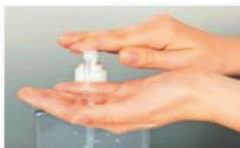
Lave sus manos gel antibacterial.