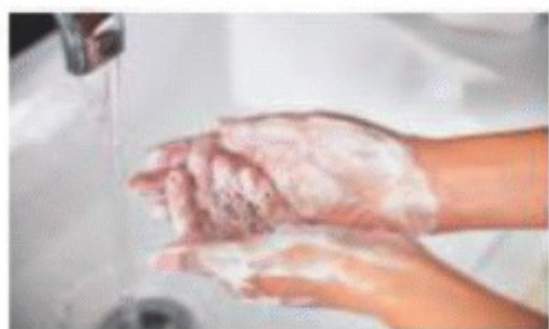
Lave sus manos con agua y jabón.