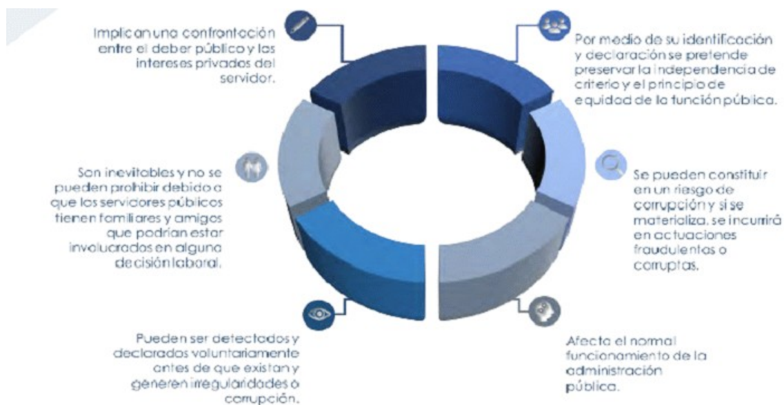
Ilustración 1: Características de los conflictos de intereses. Adaptado de (DAFP, 2017)